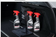
Zestaw kosmetyków samochodowych Toyota Kosmetyki