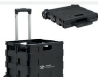
Skrzynka bagażowa Gadżety