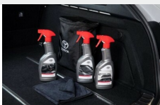
Zestaw kosmetyków samochodowych Toyoty Kosmetyki