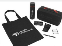
Zestaw prezentowy Professional Gadżety