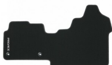
Dywaniki tekstylne (czarne) Dywaniki / Wykładziny